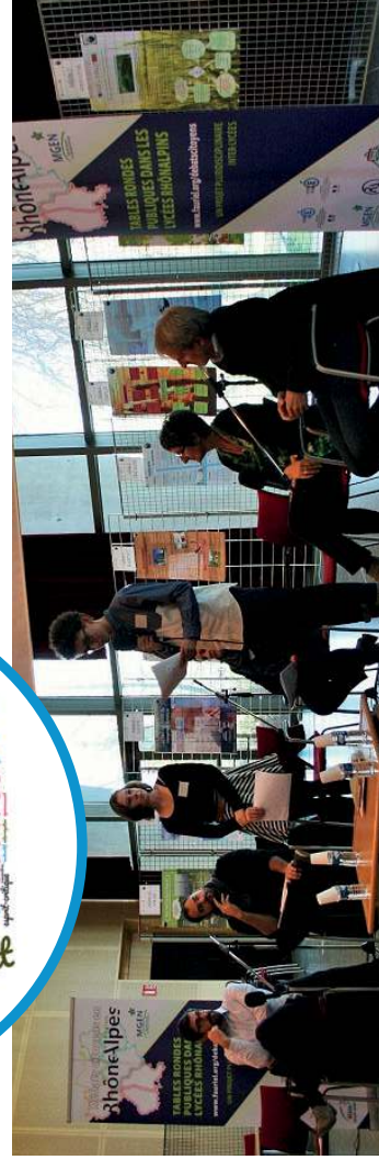
Avec le soutien de la Région Auvergne-Rhône-Alpes, des académies de Lyon et Grenoble, de la IGEN.