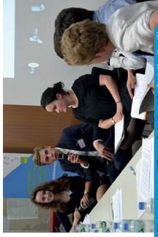
Débat entre lycéens - « AURA - une Région d'avenir ? » (Lycée Massillon, 69).

Laurent Wauquiez , Président de la Région Auvergne-Rhône-Alpes (préface 2016).