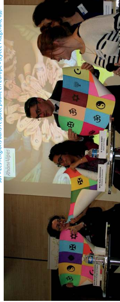
Remise d'affiches aux intervenants de la table ronde sur « Les religions dans l'espace public en Europe » (Lycée Fitzgerald, 69).