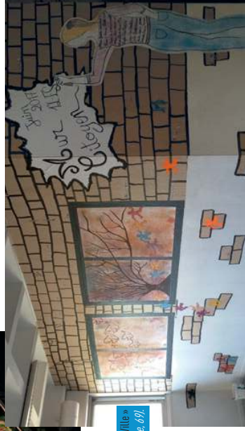
Mur citoyen réalisé suite à la table ronde « L'Art dans la Ville » (Lycée J.-P. Sartre, 69).