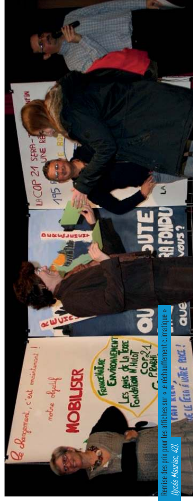
Rémission des prix pour les affiches sur « le réchauffement climatique » (Lycée Maurice, 42).