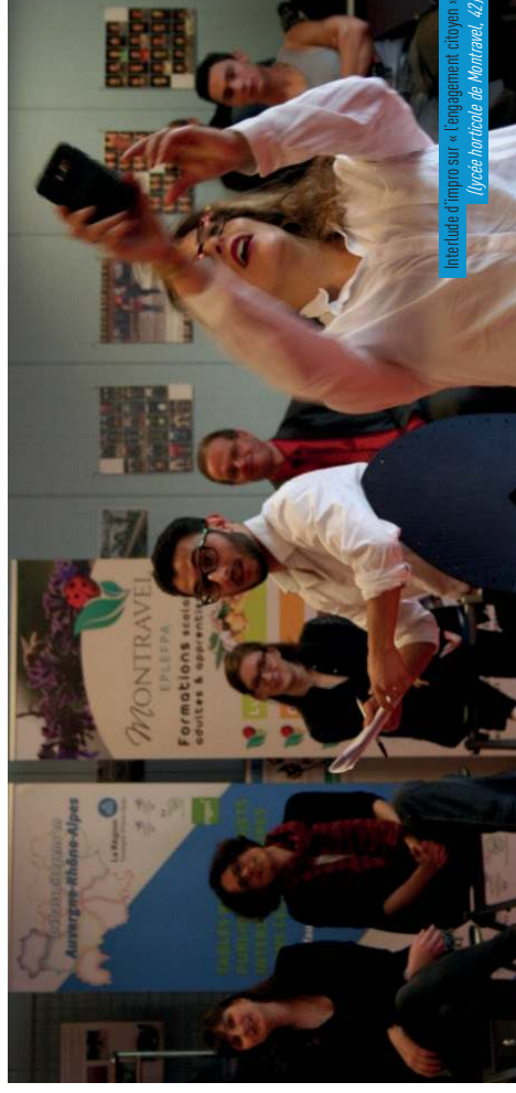
Interlude d'impro sur « l'engagement citoyen » (Lycée Hortale de Montravel, 42).