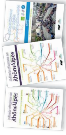
Chaque année : parution d'un ouvrage collectif (co-édition Lycée Fauriel / Adapt, 300 p., 1500 exemplaires).