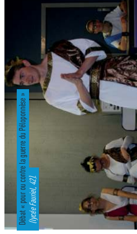
Débat « pour ou contre la guerre du Péloponnèse » (lycée Fauriel, 42)