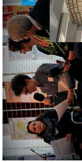
Table ronde et émission radio sur le changement climatique (Lycée l'Osaret, 38).