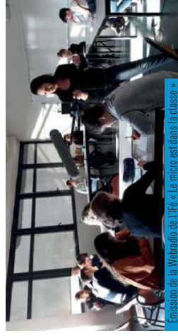
Emission de la Webradio de l'IPE « Le micro est dans la classe » (lycée Blaise-Pascal, 49)

L'expérimentation permet d'améliorer la méthodologie de Lesson Study et de développer des ressources pédagogiques utilisables par d'autres enseignants afin de faciliter l'essai-mage. Une formation « ouverte » est prévue dans la cadre du plan académique (PAF).